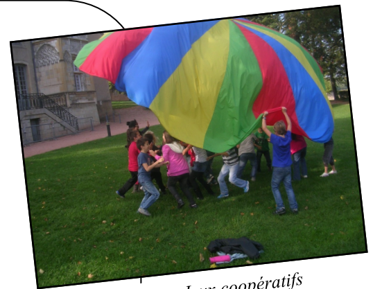
Atelier Jeux coopératifs

Toutes les coopératives scolaires et foyers coopératifs, tous les membres actifs individuels, peuvent participer à cette assemblée générale ou y être représentés par l'un ou l'autre des enseignants de l'équipe pédagogique de l'établissement. Notre règlement intérieur offre la possibilité aux membres empêchés de donner un pouvoir écrit au mandataire de leur choix.