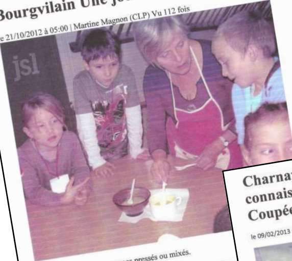
On goûte la soupe de légumes pressés ou mixés.

le 21/10/2012 à 05:00 | Martine Magnon (CLP) Vu 112 fois