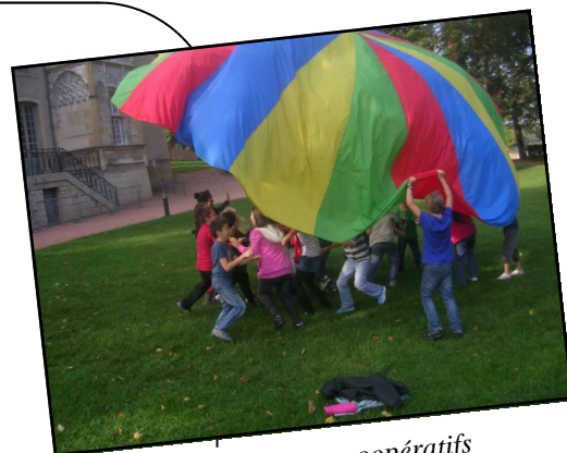
Atelier Jeux coopératifs

Toutes les coopératives scolaires et foyers coopératifs, tous les membres actifs individuels, peuvent participer à cette assemblée générale ou y être représentés par l'un ou l'autre des enseignants de l'équipe pédagogique de l'établissement. Notre règlement intérieur offre la possibilité aux membres empêchés de donner un pouvoir écrit au mandataire de leur choix.