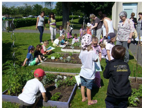
Maternelle de la Verchère - Charnay les Mâcon

Lors de cette visite, nous avons remis aux enfants de chaque école quelques ca- deaux d'encouragement (chèque de 30 € de l'OCCE et plantes, outils et livres des DDEN).