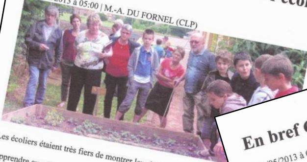
Les écoliers étaient très fiers de montrer leur jardin au jury.

le 29/06/2013 à 05:00 | M.-A. DU FORNEL (CLP)