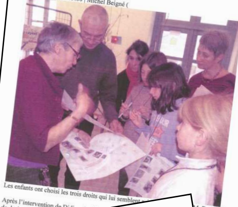
Les enfants ont choisi les trois droits qui leur semblent... M. B. (CLP)

le 21/11/2012 à 05:00 | Michel Beigné (CLP)