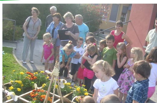
Maternelle de Branges

En partenariat avec les DDEN : 25 classes se sont inscrites cette année Chaque école inscrite dans ce projet a reçu la visite d'une commission réunissant des membres de l'OCCE et des DDEN.